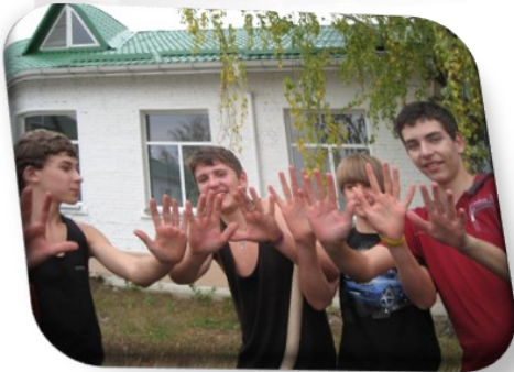
Перші трудові мозолі