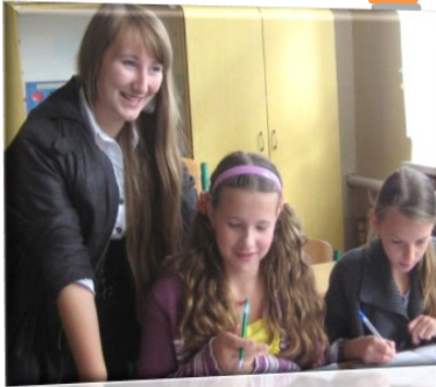
Опануємо вчительську професію